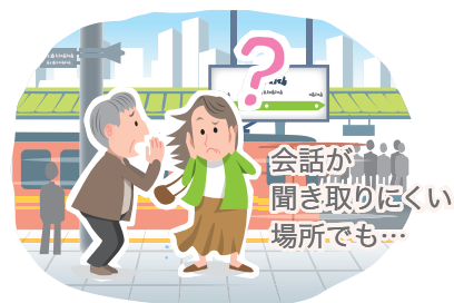
会話が聞き取りにくい場所でも...