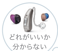
どれがいいか分からない